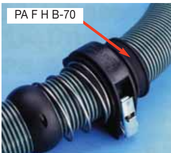
PA F H B-70

Usato congiuntamente con forcelle girevoli e anelli di protezione.