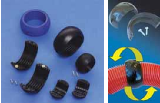
PA D P B-70