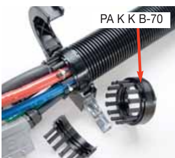
PA K K B-70

Usato congiuntamente con morsetti di chiusura e anelli di protezione.